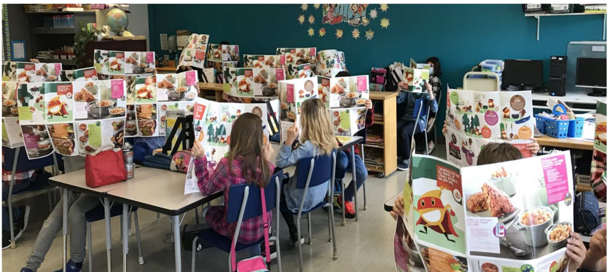
École des Pionniers

Ces commandites sont toujours très appréciées et cela particulièrement auprès des jeunes !